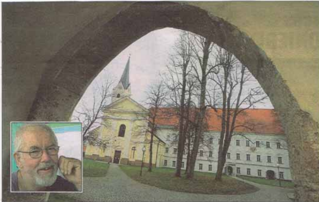
Kaufmann-Marathon: In der Kirche von Viktring, im Arkadenhof und im Kellertheater werden heute, Donnerstag, Dieter Kaufmanns „Etuden für eine bessere Welt“ uraufgeführt.