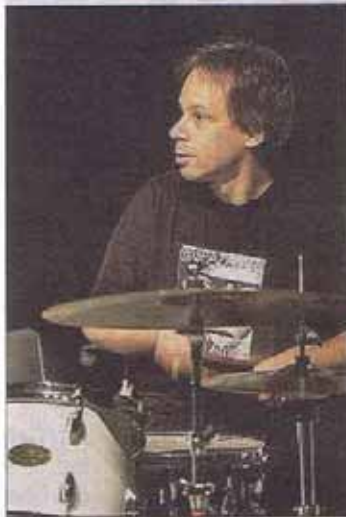
Uraufführung von Lukas Ligeti

Samstag Abend im schlecht besuchten Arkadenhof: Laue Temperaturen, riesen Glück mit dem Wetter zum Auftakt des Musikforums Viktring und zum Aufbruch in „Neue Welten“, die auch heuer den Ton angeben. Einen innovativen Brückenschlag für „Afrika meets Europe“ vollzogen Burkina Electric und Lukas Ligeti.