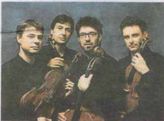
Das Quartetto Prometeo gastiert am 6. Juli im Stift Viktring MUSIKFORUM

Nähere Infos zum Programm: Tel. 0463/28 22 41 oder www.musikforum.at