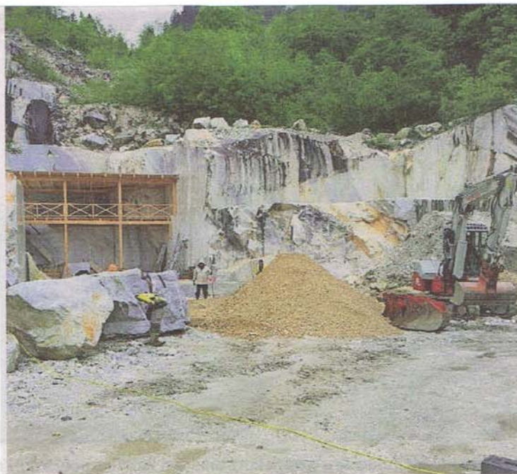
Im Marmorsteinbruch Krastal hat kürzlich der Aufbau für die beliebten »Gegendtaler Passionsspiele« begonnen.