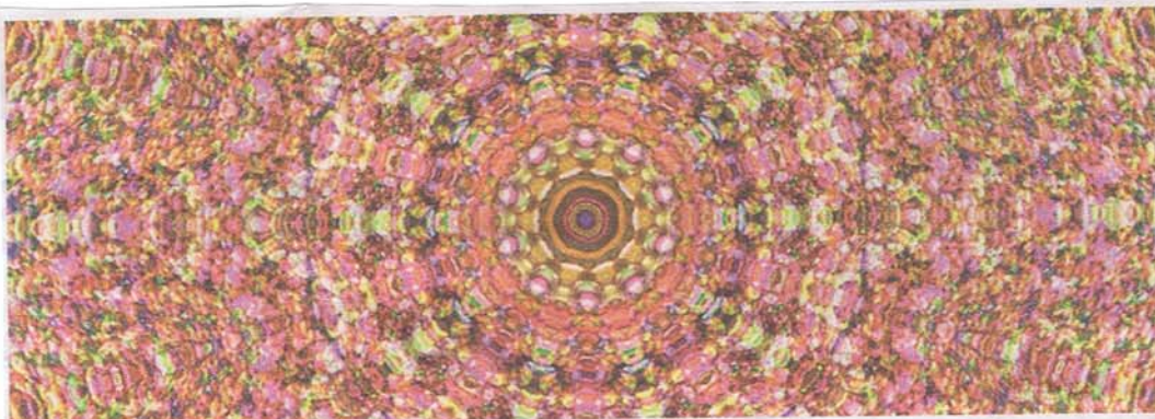
Asiatisch inspiriert: Bühnenbilder von Bärbel Neubauer im Stift Viktring.